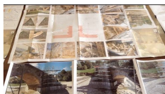
Via le auto da Ponte Buriano: ripartono i lavori sui rostri. 45